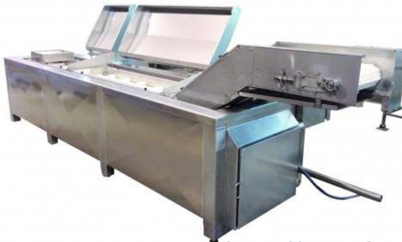
Marmita y Freidora Continuo